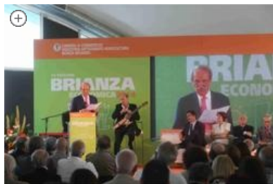
Monza - La rassegna Brianza economica 2014, a cura della CAMERA DI COMMERCIO DI MONZA E BRIANZA (foto Fabrizio Radaelli)