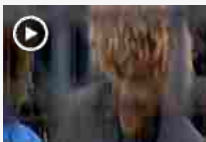
Valderrama e la moglie uniti anche nel taglio di capelli