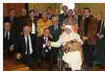
Roma, sabato i nuovi 'Cavalieri'