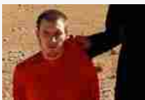
Kobane sventola la bandiera nera dell'Isis