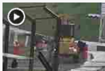
F1, Suzuka: le impressionanti immagini