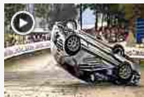
Heloise, spettacolare incidente al Rally di Francia